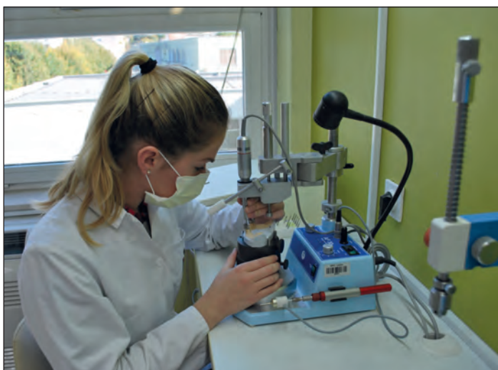
Delo v laboratoriju danes.

poučevanje. Pri svojem delu stremimo k še večji natančnosti, boljšim dosežkom in približevanju vrhunskosti. Kljub sodobnim tehnologijam pa se zavedamo, da je roka zobotehnika tista, ki ustvari nasmeh.