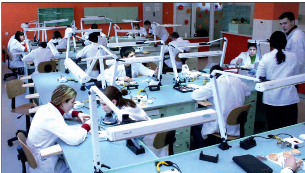
Spodnji zobotehnični laboratorij.