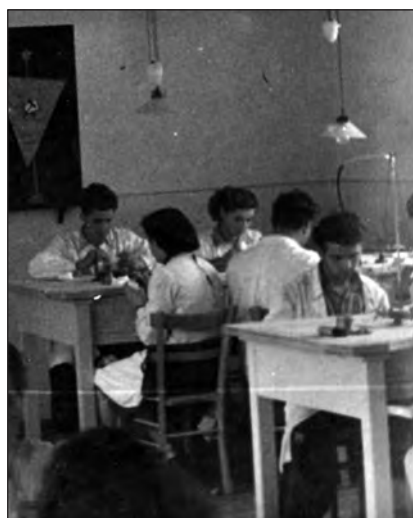
Delo v laboratoriju nekoč.